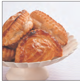
ショソソ・オ・ボンム