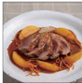
鴨のロースト オレンジソース