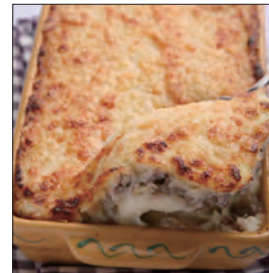
ジャガイモとひき肉のグラタン