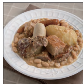
グランドゥ・キャスレ