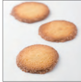
サブレ・オランジュ