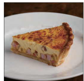
キッシュ・ロレーヌ