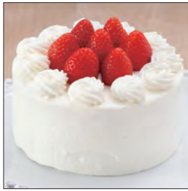
苺のショートケーキ

洋菓子屋さんに並んでいるモンブランや苺のショートケーキなど、馴染みのおいしいお菓子を、子どもたちのために作ってあげたい。そんな気持ちをお持ちのお母さんや、忙しく過ごしている日々の中で楽しめるお菓子作りを習いたいOLの方にはピッタリです。