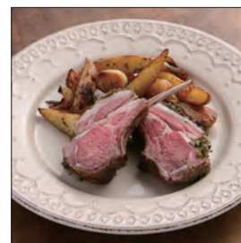
仔羊の香草風味焼き