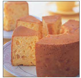
レモンのシフォンケーキ