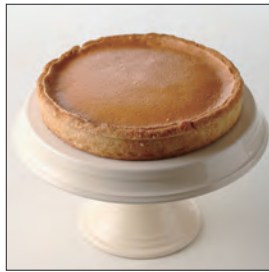
タルトゥ・オ・シトロン