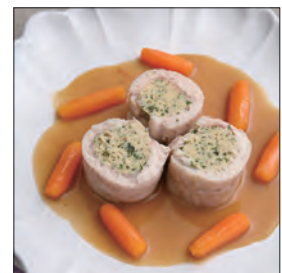
金目鯛のムース香草風味