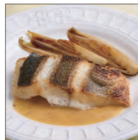
スズキのクミン風味ソース