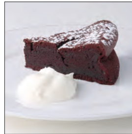
ガトー・ショコラ