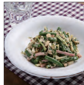
サラダ・トロペジェヌ