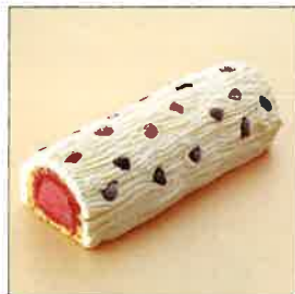
過ぎし日の淡い思いの グリヨットゥの氷菓