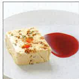
ヌガー・グラッセ