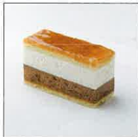
ガトー・サンマルク