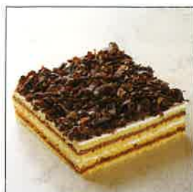
フォレ・ノワール