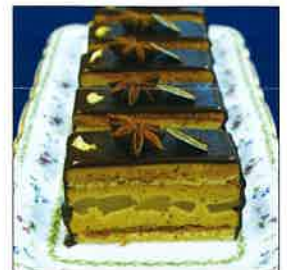
ブラン・スイエル