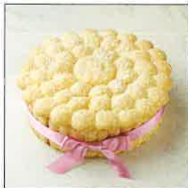
シャルロット・オ・フレーズ