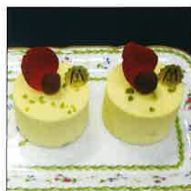
フレッシュール・デテ