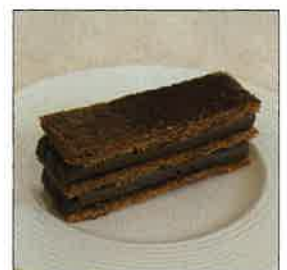
ミルフィーユ・オ・ショコラ