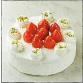
苺のショートケーキ

洋菓子屋さんに並んでいるモンブランや苺のショートケーキなど、馴染みのおいしいお菓子を、子どもたちのために作ってあげたい。そんな気持ちをお持ちのお母さんや、忙しく過ごしている日々の中で楽しめるお菓子作りを習いたい OL の方にはピッタリです。