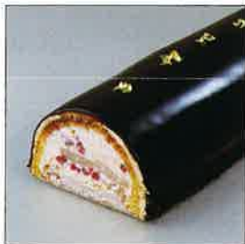
トゥランシュ・シャンブノワーズ

本科第1クールを卒業された方が、より一層お菓子作りを探求されるためのクラスです。どのクラスから受講しても構いません。イル・プルー・シュル・ラ・セーヌ顧問ドゥニ・リュッフェル氏の講習会やイル・プルーの1年で発表された弓田亨のオリジナル菓子を中心に、より深いイル・プルー・シュル・ラ・セーヌのイマジナスィオン豊かな菓子作りの世界を学ぶことができます。