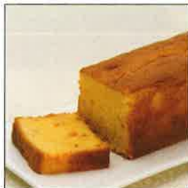
オレンジのパウンドケーキ