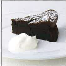
ガトー・ショコラ