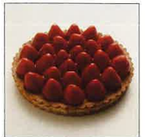
タルト・オ・フレーズ